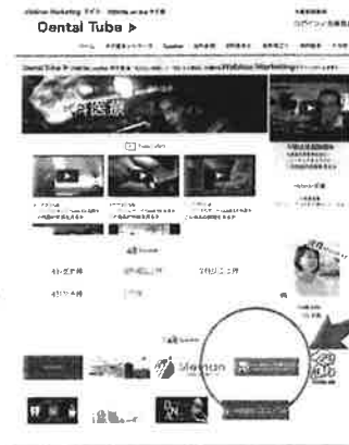
DENTAL TUBE https://www.dental-terakoya.com

https://www.dental-terakoya.com/terakoya