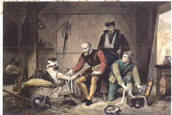
16th Century Prosthetics from Ambroise Pare より

9:30～ 受付開始 10:00～10:30 開会式 協賛企業紹介 10:30～11:40 メーカー発表 株式会社ジーシー 11:40～12:00 カービングコンテスト表彰式 12:00～13:00 昼食 13:00～16:00 企画講演 山口能正 氏 16:00 終了