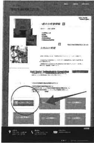
愛知県歯科技工士会オフィシャルサイト https://www.aichi-dt.com